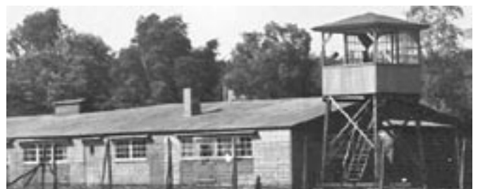
Kamp Amersfoort 1941-1943.