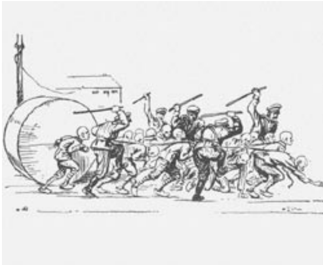
De Palestina Expres of Judenkommando.