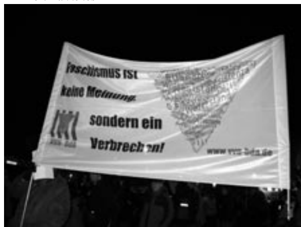
Duitse anti-fascisten van de VVN-BdA waren ook met een spandoek aanwezig.