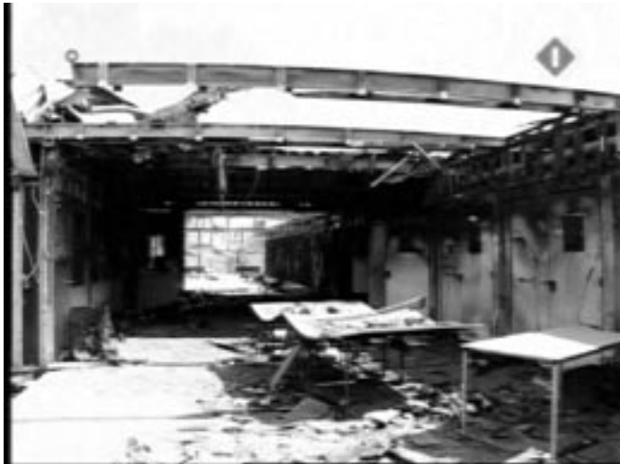
De ravage in de K-vleugel na de brand

gêne begint af te tekenen. En het is dan ook niet ondenkbaar dat tenminste een deel van Kamer, net zoals zo langzamerhand een breed deel van de samenleving, nu eindelijk afstand wenst te gaan nemen van de vergaande ontmenselijking van 'illegalen', die de laatste jaren de maatschappij in een wurg-greep heeft gehad.