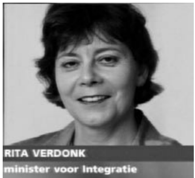
Volgens het rapport van de onderzoeksraad is er dus absoluut NIET adequaat gehandeld!

Onze argumenten voor dat eerste zijn overvloedig.