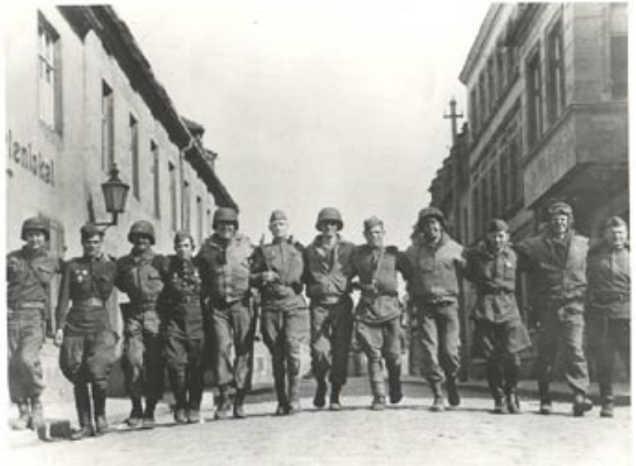
Geallieerde bondgenoten aan de Elbe

Voor het overige deel van Duitsland zagen de Fransen liever geen verbodskeling maar eerder een verbond van staten. In 1946 besepte de opvolger van De Gaulle dat de politiek van 1943-1945 achterhaald was: de geallieerden waren tegen, en het uitgeputte Frankrijk had de middelen ertoe niet. In Parijs werd overgestapt van een visie van het Duitse gevaar op een visie van het 'Russische Gevaar' (het begin van de Koude Oorlog, voortzetting van de 'Warme Oorlog') een tussenstadium waarbij Duitsland onder controle zou staan van Moskou (Rapallo-komplex).