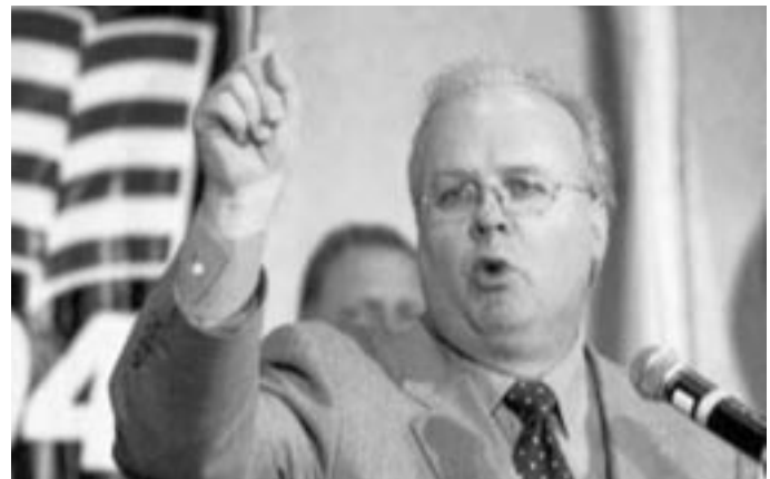
Karl Rove. De man die werkelijk aan de touwtjes trekt ?

...Laten we eens kijken naar de man die werkelijk aan