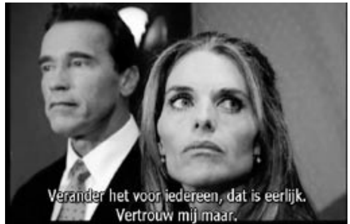
Arnold's vrouw, Maria Shriver, is een lid van de Kennedy-familie

...Hij is heel kundig naar voren geschoven als toekomstig