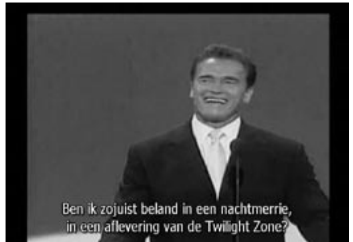
Arnold Schwarzenegger terwijl hij toegejuicht wordt op de RNC.