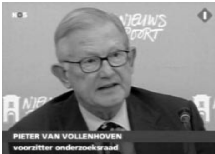
Een keihard rapport

Want het OM weet hier niets beters te doen dan terug te vallen op eigen fantasieën over de inhoud van de door ons ingediende strafklacht. Want het feit dat wij inderdaad de misdrijven die het OM hier construeert in het geding zouden hebben gebracht bestaat als zodanig slechts in de verbeelding van het OM zelf.