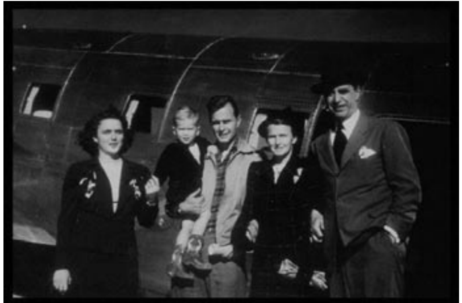
Drie generaties Bush. Rechts Prescott Bush met zijn vrouw Dorethy Walker

Prescott Bush is de grootvader van George W. Bush en de vader van George Herbert Walker Bush, die zijn naam heeft van zijn vaders schoonvader George Herbert Walker. Prescott Bush studeerde af en verliet de Yale-universiteit in 1917. Hij was lid van Skull en Bones (zie vorige nummer blz. 3. nvdr) samen met E. Roland Harriman, de jongere broer van W. Averell Harriman. De Bush-familie was niet welvarend. Ze werkten zich omhoog in de