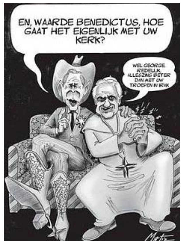
Werd hier ook al iets geregeld?