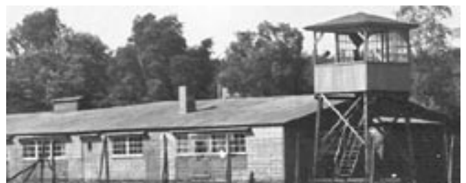
Kamp Amersfoort 1941-1943. De laatste twee afbeeldingen zijn van de website van Kamp Amersfoort