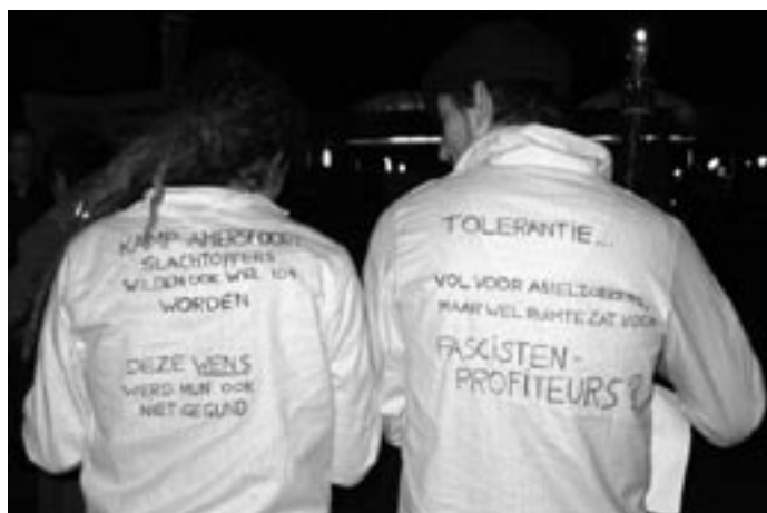
Jonge anti-fascisten met op hun ruggen de veelzeggende teksten: "Kamp Amersfoort slachtoffers wilden ook wel 104 worden. Deze wens werd hen ook niet gegund". En "Tolerantie... Vol voor asielzoekers, maar wel ruimte zat voor fascisten-profiteurs."

Bij de Flint kwam ook een groepje neofascisten opdagen dat van plan was om de actievoerders aan te vallen. Na wat provocaties greep de politie, die in grote getale aanwezig was, in en de extreem-rechtse Heesters-supporters werden