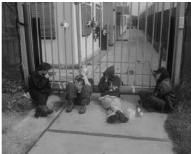
Aktievoerders voor de poort, met speelgoed voor de kinderen

E-Mail: stopdeportaties@yahoo.com Website: http://stop_deportaties.mahost.org/ http://www.jokekaviaar.nl