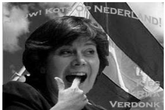
Trots Op Nederland (TON), de beweging van Rita Verdonk. Vroeger scheidt de arbeidersklasse op 'de ton', hopelijk doen ze dat bij de volgende verkiezingen ook massaal!