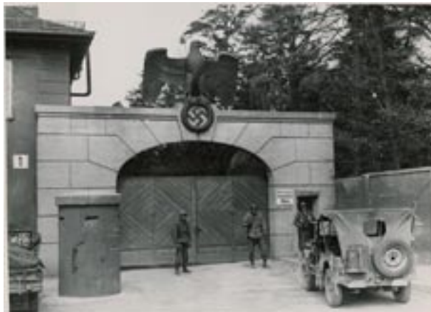
Dachau: In- uitgang voor het echte tuig