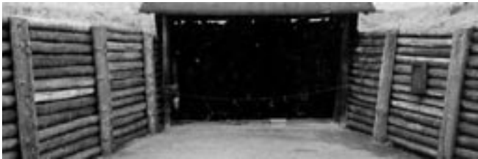
De executieplaats in Sachsenhausen