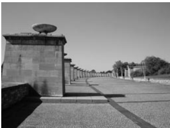
Het monument van Buchenwald ligt op een heuvel die uitkijkt op Weimar en de vlakte van Jena. Weimar is de stad van Goethe, de Weimar republiek