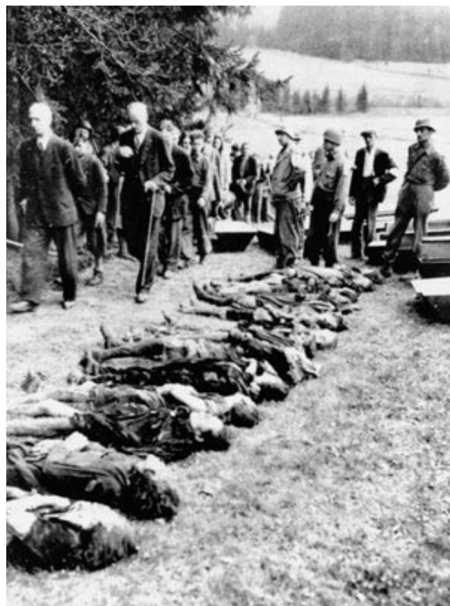
Inwoners van Weimar worden in het kamp langs de slachtoffers geleid door de geallieerden