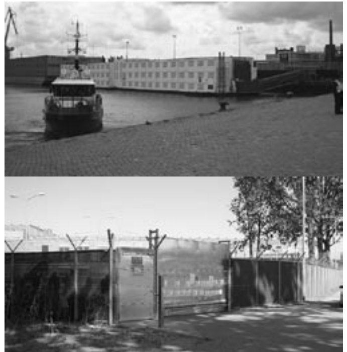
Bajesboot: Vanaf de waterkant en vanaf de landkant. Bepaald geen opvang van daklozen, maar van zware criminelen!

Sinds een paar jaar zet de overheid illegalen niet alleen gevangen in gebouwen, maar ook op boten.