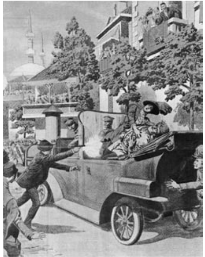
Gedramatiseerde tekening van "de pistoolschoten in Sarajevo"

Volgens het Volkenrecht zou dit mogelijk zijn, indien Belgrado met zo'n oplossing instemt, of tenminste de VN-Veilighedsraad zo'n oplossing toestaat. Zijn beide voorwaarden niet vervuld, dan kan Kosovo zich slechts eenzijdig, dus door een willekeurige, illegale handeling, tot zelfstandige staat uitroepen. Maar juist dit zou de komende weken gaan gebeuren. Zoals ten tijde van de overgang van de negentiende naar de twintigste eeuw komen op de Bal-