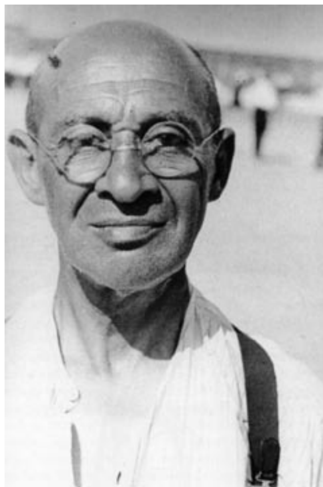
Fritz Grünbaum in Dachau, 28 juni 1938

4 24.6.1883 in Wildenschwert, Bohemen, † 4. 12.1942 in Auschwitz), Oostenrijkse librettist, tekstschrijver van schlagers en schrijver