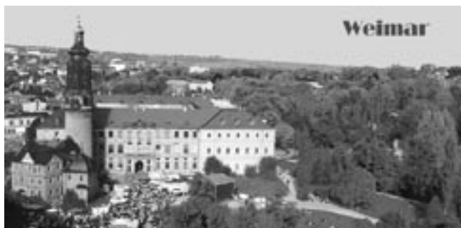
Buchenwald is geografisch gelegen in centraal Duitsland aan de vroegere grens van de DDR en de BRD.

Symposia worden geregeld door de FIR i.s.m. de kampvereniging.